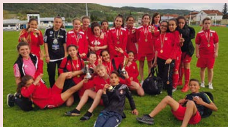
La joie des récompenses au LCA Foot 38

Côté pile, le club a déposé un dossier de labellisation auprès de la FFF (Fédération Française de Football). Ce label, décerné à seulement 10% des clubs isérois, récompense les clubs pour la qualité de leur structuration, des équipements, de l'accueil et de l'encadrement technique.