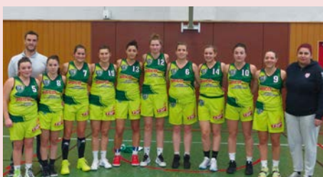
Une des équipes féminines du basket

Nous l'avions annoncé lors de notre dernière communication l'équipe Féminine de TFB