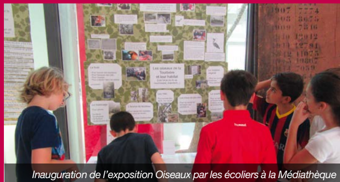
Inauguration de l'exposition Oiseaux par les écoliers à la Médiathèque

trois reprises à la Tourbière du Grand Lemps. Dans cet Espace Naturel Sensible les élèves ont été sensibilisés aux chants des oiseaux présents dans la réserve, à leur habitat, à leur adaptation au milieu suivant les saisons, à leur régime alimentaire... Un travail de recherche et de rédaction a été mené en classe pour réaliser des affiches, des dessins, des cartels. Travail facilité et guidé par une visite au Muséum d'Histoire Naturelle de Grenoble sur le thème « Comment mettre en valeur une exposition ? ». Les mobiles d'oiseaux réalisés par les CM1-CM2 en classe avec l'aide d'un artiste plasticien ont d'ailleurs participé à cette mise en valeur. Les élèves ont pu constater en se rendant à la médiathèque que tous leurs travaux avaient été exposés pour leur plus grande fierté. Ils adressent un grand merci à la médiathèque et à toutes les personnes qui ont pu intervenir auprès d'eux grâce au soutien financier du Conseil Départemental.