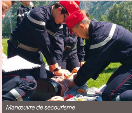
Manœuvre de secourisme

Depuis 2012, ce sont au total 22 jeunes qui ont réussi les 4 années de formation, leur permettant ainsi la meilleure intégration