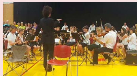
"Il était une fois dans l'Ouest... des Terres froides"

Contact : Ch. Guillaud-Rollin 04 76 55 82 81 - christophe.guillaud-rollin@orange.fr